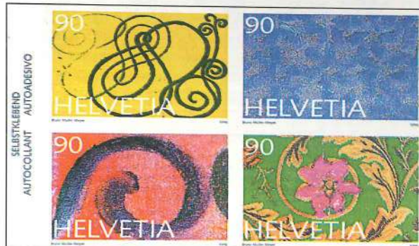
Sellos de Suiza de 1996 emitidos en carnet autoadhesivo para «ocasiones especiales».

Cuando los avances de la tecnología han empezado a sustituir a la carta tradicional, parece que las administraciones postales, de común acuerdo, quieren resaltar el valor sentimental del correo. Los sellos emitidos con esta intención constituyen una nueva temática que hoy vive un gran auge.