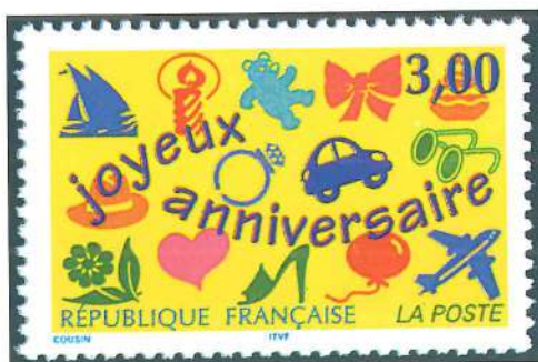
Sello de felicitación emitido por Francia en 1997.