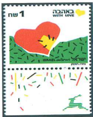
Sello de Israel emitido en 1977 bajo el lema «con amor».

Los nombres que se dan a este tipo de sellos son muy variados: Suecia (que se incorporó a esta temática en 1995) les llama «sellos con mensaje», Corea del Sur «sellos de salutación y Año Nuevo», Finlandia «sellos de saludo amistoso», Nevis «sellos de amor», titulación que usan también Palau, Polonia e Irlanda. Suiza los denomina «sellos para ocasiones especiales», Holanda (que en 1997 lanzó una serie de «sellos sorpresa») «sellos festivos y de aniversario», Egipto «sellos para las fiestas», Japón y Singapur «sellos de salutación»... Otros países, como Argentina o la República Checa, no titulan estas series, pero su finalidad es la misma: mejorar las relaciones a través de ellos. En algunos Estados estas emisiones han sustituido a las tradicionales series de Navidad, o se emiten en estas mismas fechas, por lo que algunos coleccionistas también las incluyen en esta temática. No solo la Royal Mail británica aplica la «Firts Class Stamp» (sello de primera clase), la tarifa de correo interior (1 st) que se cobra al valor actualizado en el momento de la compra y tiene validez siempre. Otros