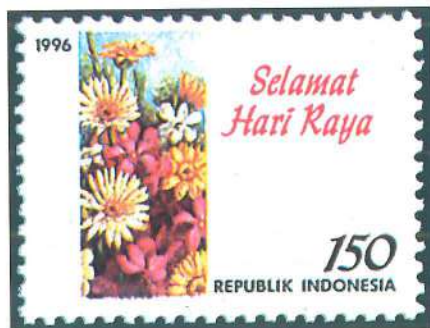
Sello de salutación emitido por Indonesia en 1996.