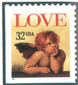
«Sello de amor» de 1996 emitido por Estados Unidos.

pegados en el sobre, indican la finalidad de la carta sin abrirla; son amenos, divertidos y cumplen su objetivo en momentos especiales. Los sellos o las etiquetas que los acompañan transcriben las frases apropiadas: «mis mejores deseos», «gracias», «feliz cumpleaños», «con amor», «saludos», «felicidades», «buena suerte», «bien hecho» y «te quiero» figuran entre las leyendas más usuales.