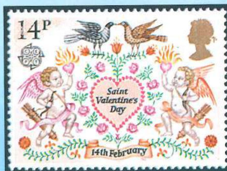
Emisión dedicada a San Valentín por Gran Bretaña (1981).

Este mártir pudo ser un sacerdote romano que murió decapitado en el año 270, aunque no existen noticias ciertas sobre su vida, y es la figura que la tradición popular ha elegido internacionalmente como el patrono de los enamorados. Su fiesta, que se celebra el 14 de febrero, es recordada por miles de parejas y también por la filatelia de numerosas administraciones postales. Son muchos los países que a lo largo de los años le han dedicado sellos, emisiones que hoy forman parte de la temática dedicada a los sellos de felicitación.