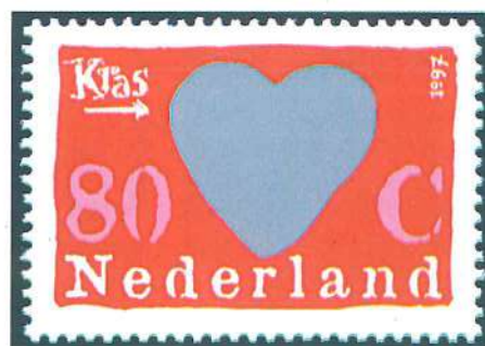
Emisión holandesa de 1997, realizada en minipliego, que pertenece a sus series de sellos de felicitación y sorpresa.

de presentar los sellos y los sobres no se hizo esperar, y con la aparición de nuevas emisiones nació esta temática, que es una de las más recientes, ya que se comenzó a considerar como tal entre 1994 y 1995, años en que una docena de países se incorporaron a esta corriente. En 1996 y 1997 una veintena de países más se adhirió al tema. La razón de que estos sellos hayan tenido tan buena acogida es su contenido. Al verlos