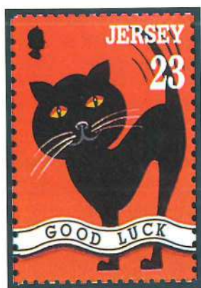
Sello de salutación emitido por Jersey en 1995.

pegados en el sobre, indican la finalidad de la carta sin abrirla; son amenos, divertidos y cumplen su objetivo en momentos especiales. Los sellos o las etiquetas que los acompañan transcriben las frases apropiadas: «mis mejores deseos», «gracias», «feliz cumpleaños», «con amor», «saludos», «felicidades», «buena suerte», «bien hecho» y «te quiero» figuran entre las leyendas más usuales.